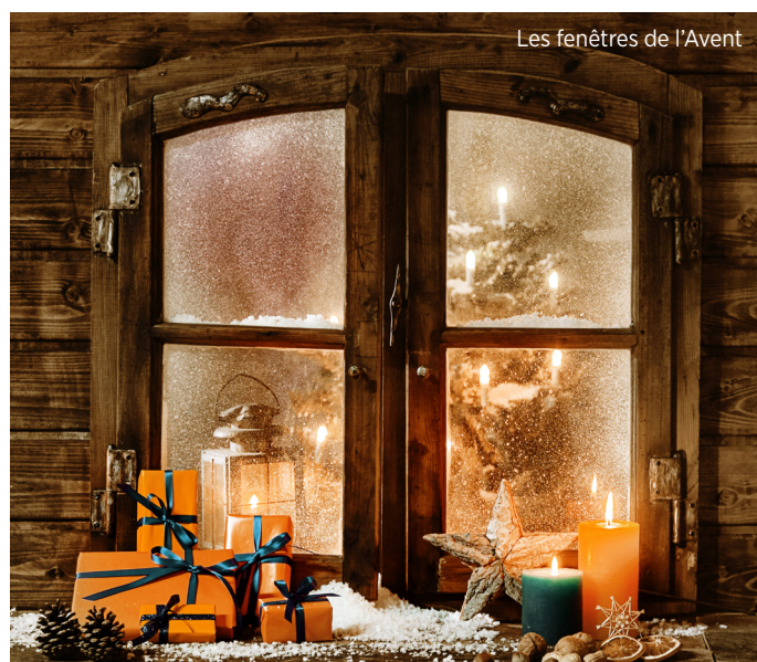
Les fenêtres de l'Avent